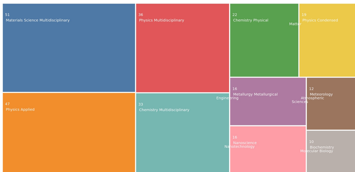
Fig. 2 Distribuția pe domenii/subdomenii a lucrărilor științifice, având autori/coautori din Facultatea de Fizică a Universității din București, publicate în 2020.