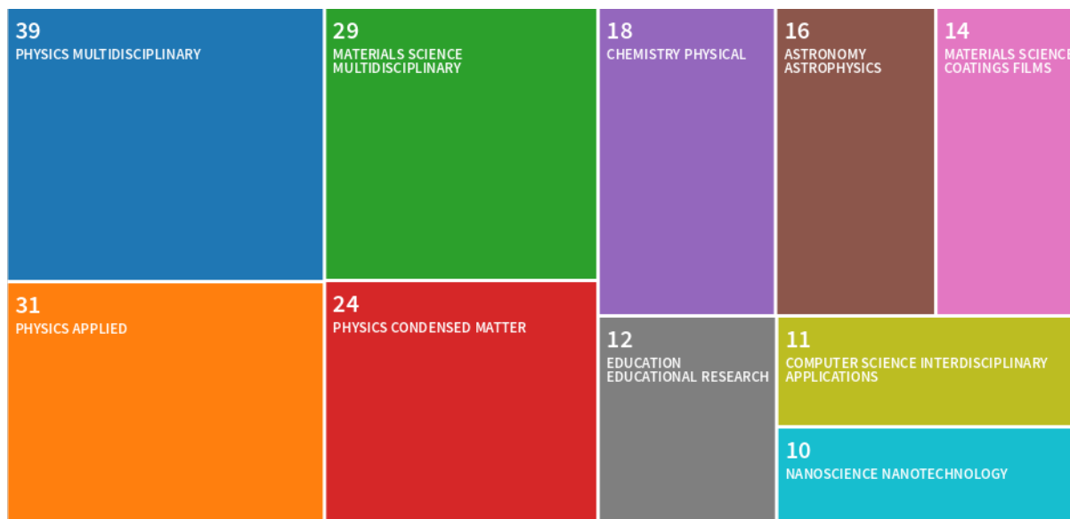
Fig. 2 Distribuția pe domenii/subdomenii a lucrărilor științifice, având autori/coautori din Facultatea de Fizică a Universității din București, publicate în 2019.

Calitatea rezultatelor cercetării desfășurate în facultate este demonstrată de tendința ascendentă a numărului de citări obținute în literatura de specialitate (reviste indexate ISI) (a se vedea Fig. 1). Apreciem ca foarte bune rezultatele cercetării, în raport cu nivelul de finanțare al acestor activități.